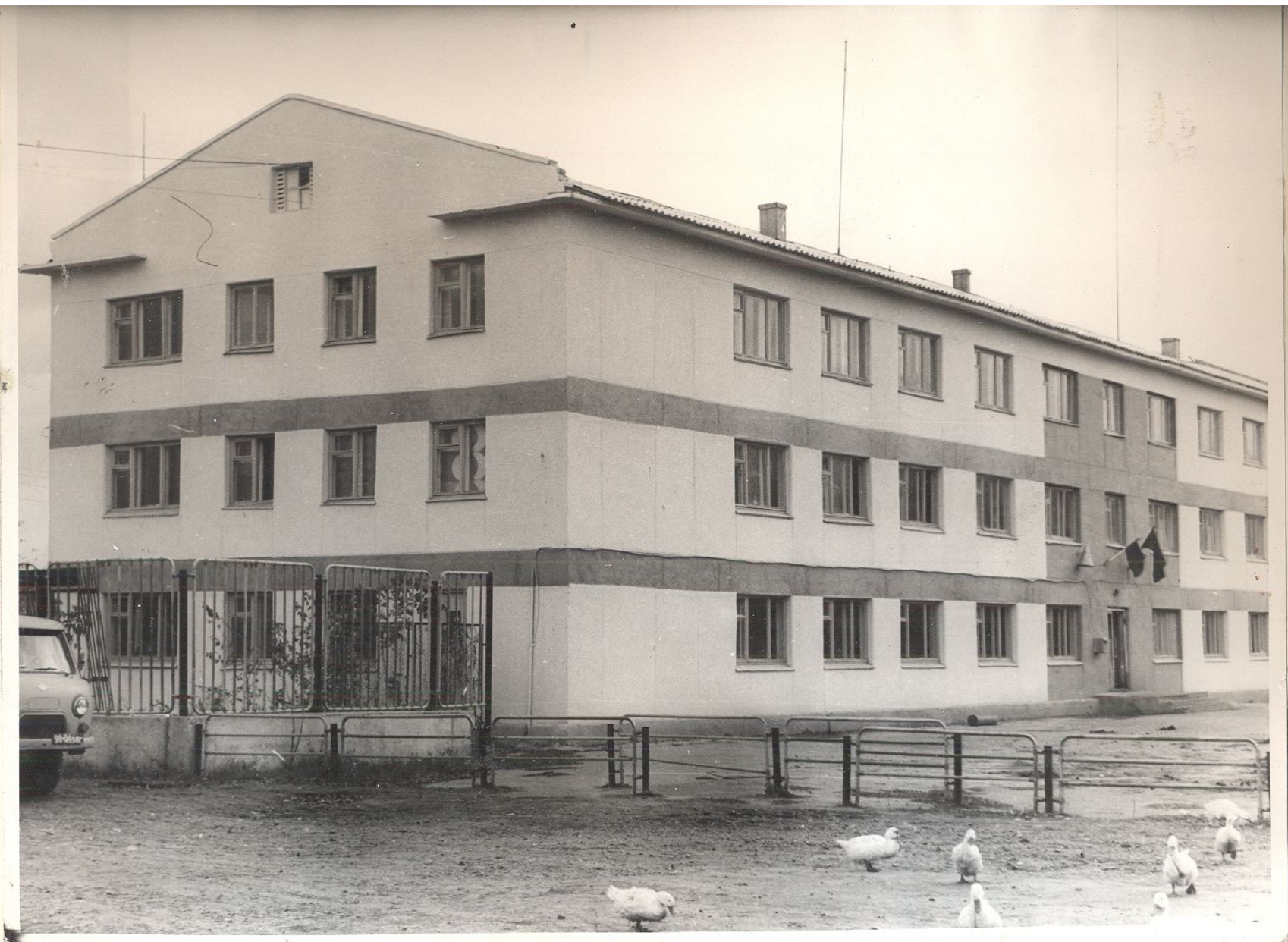
с. Пестровка. Здание РАПО.