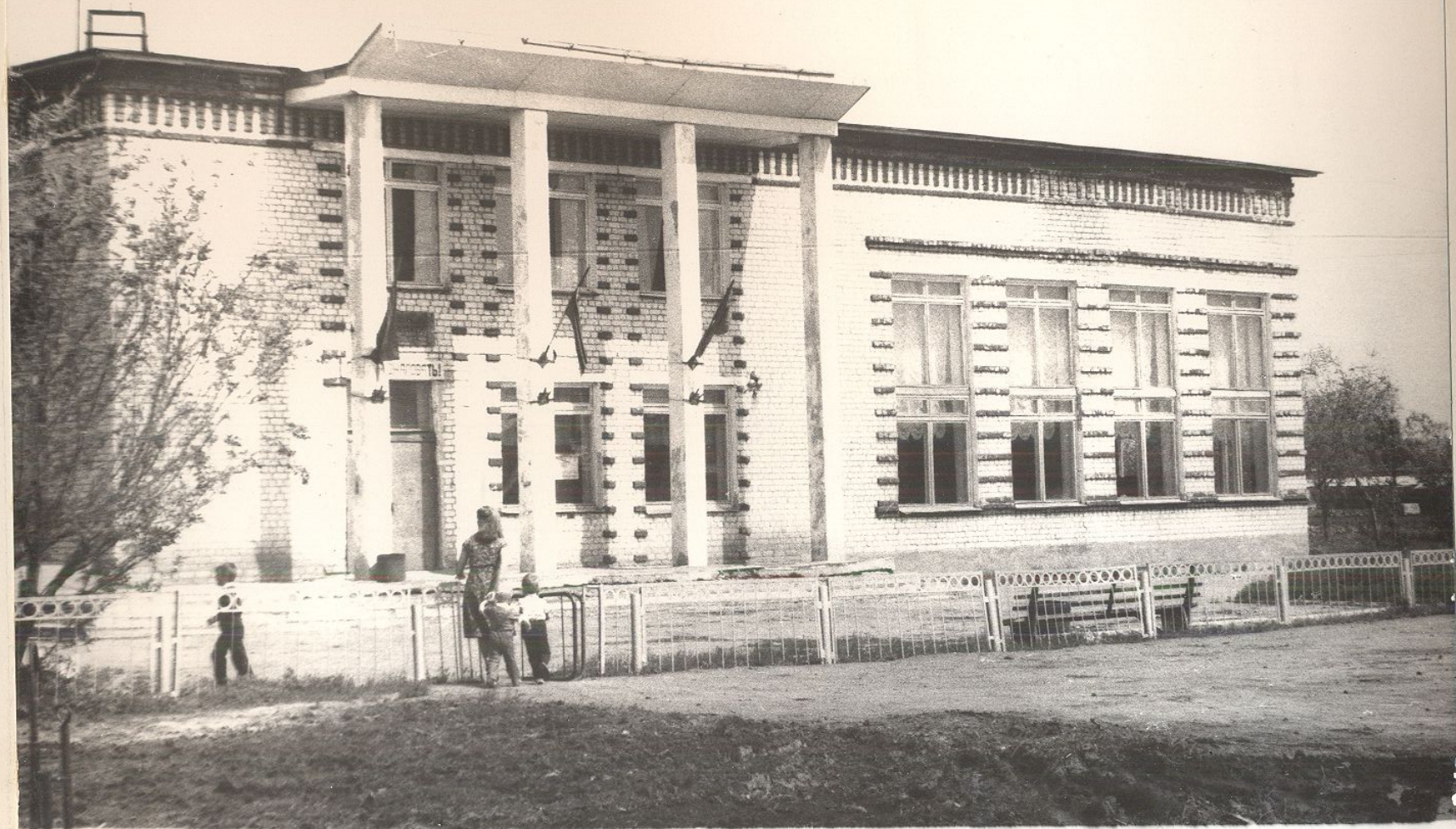
Сельский Дом культуры в селе Марьевка.