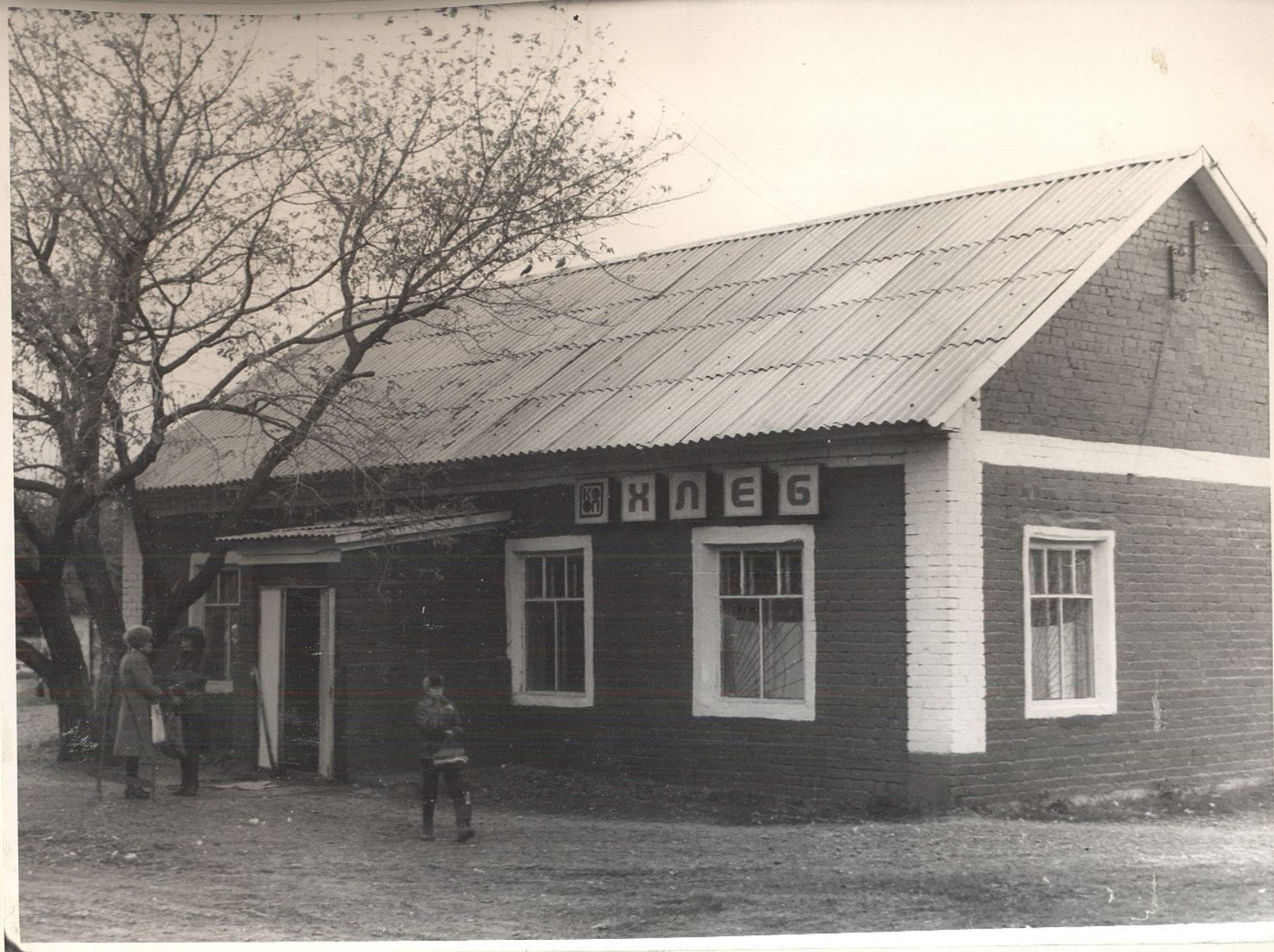
с. Пестровка. ХЛЕБНЫЙ МАГАЗИН ПОСЛЕ КАПИТАЛЬНОГО РЕМОНТА.