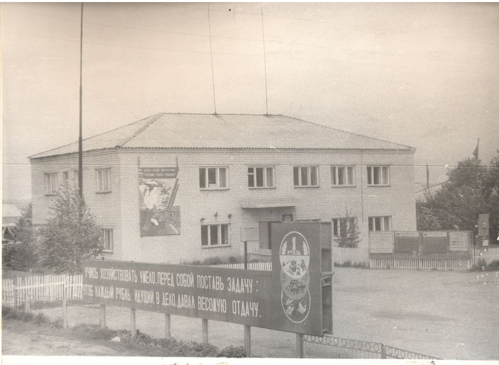
с. Марьевка. Управление колхоза им. Чапаева.