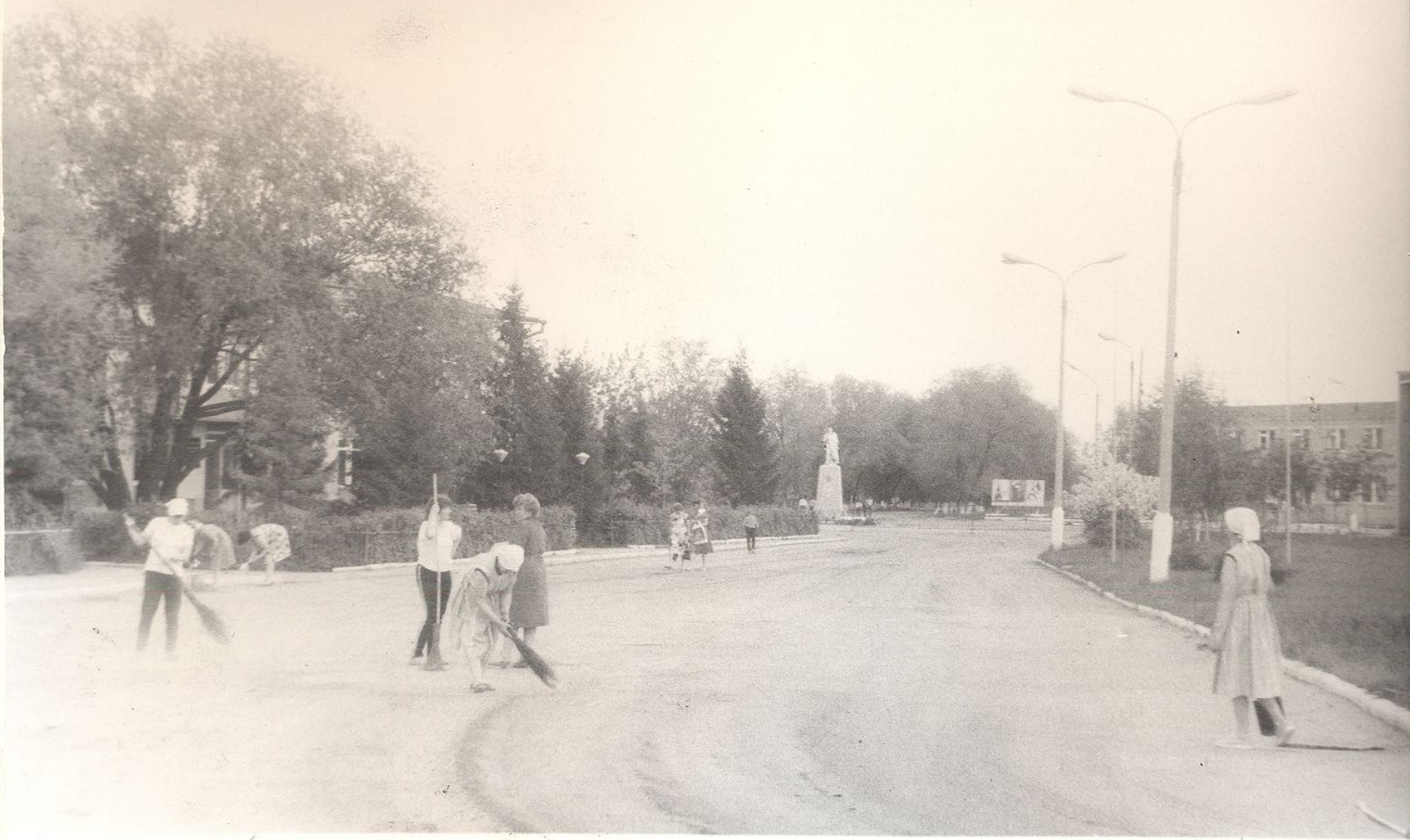
НАСЕЛЕНИЕ РАЙОНА ПРИНИМАЕТ АКТИВНОЕ УЧАСТИЕ В БЛАГОУСТ- РОЙСТВЕ СЕЛА.