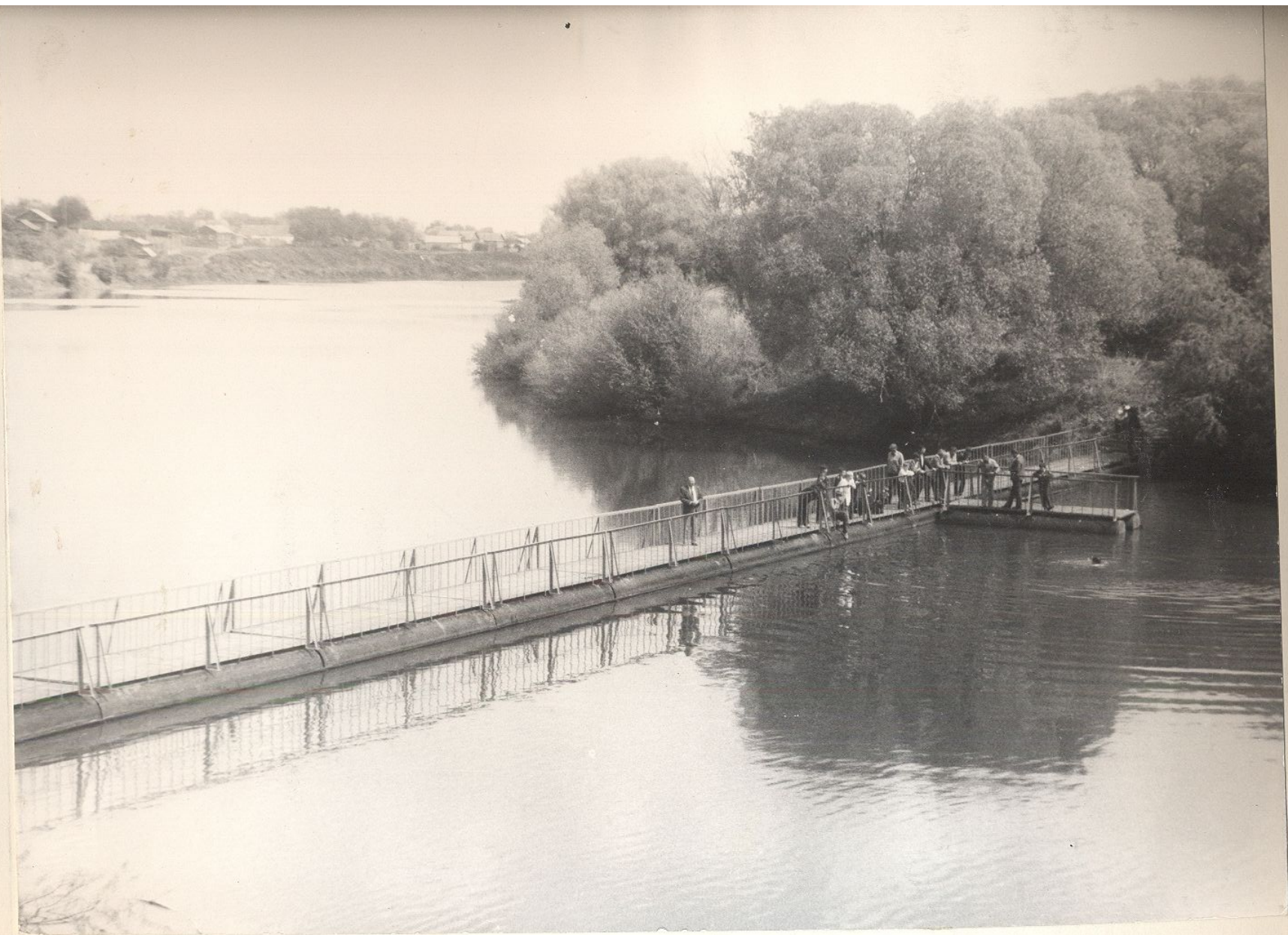
Заречная зона отдыха стала доступнее для населения района. с. Пестровка.