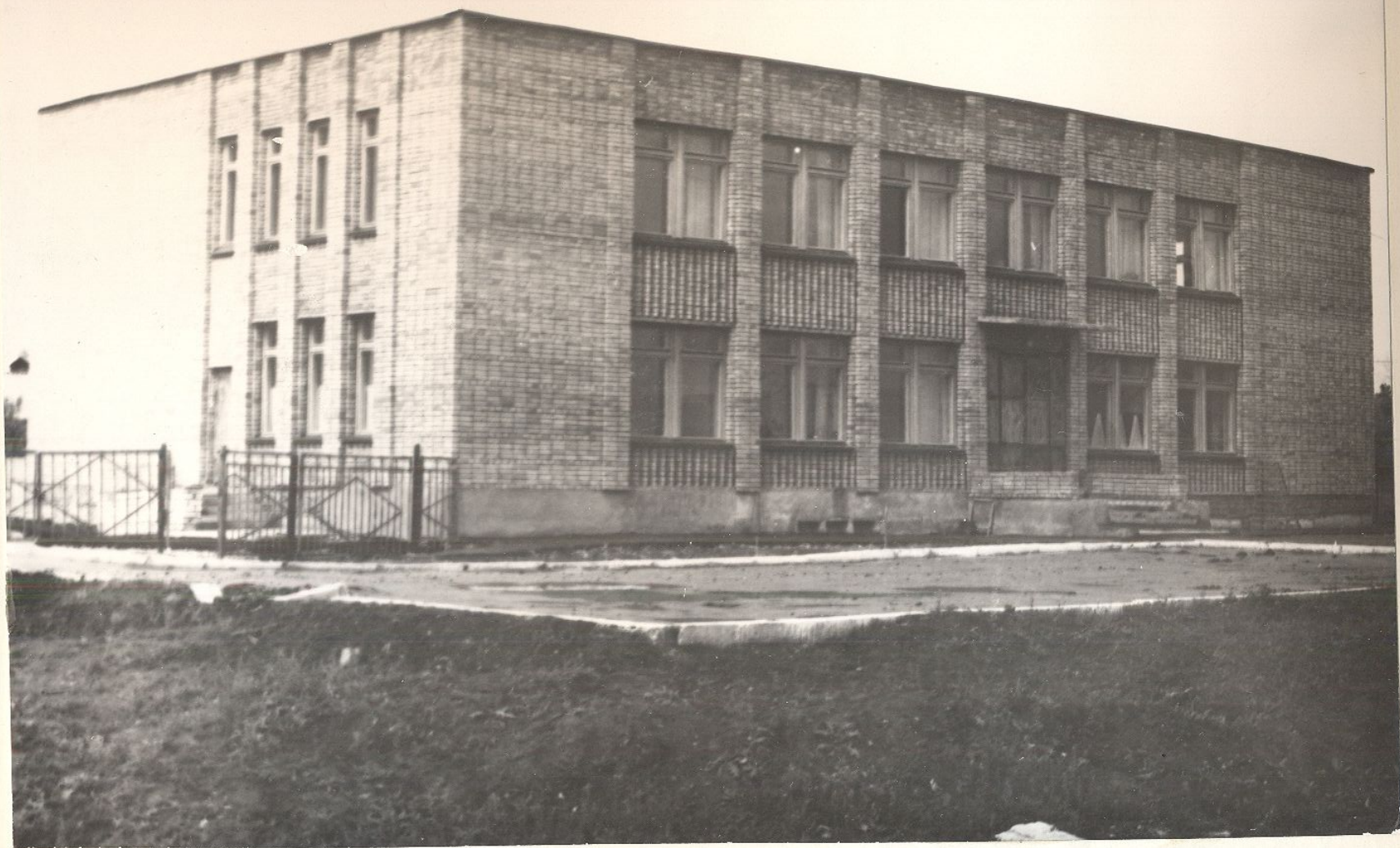
с. Пестровка . Здание районной аптеки с эс