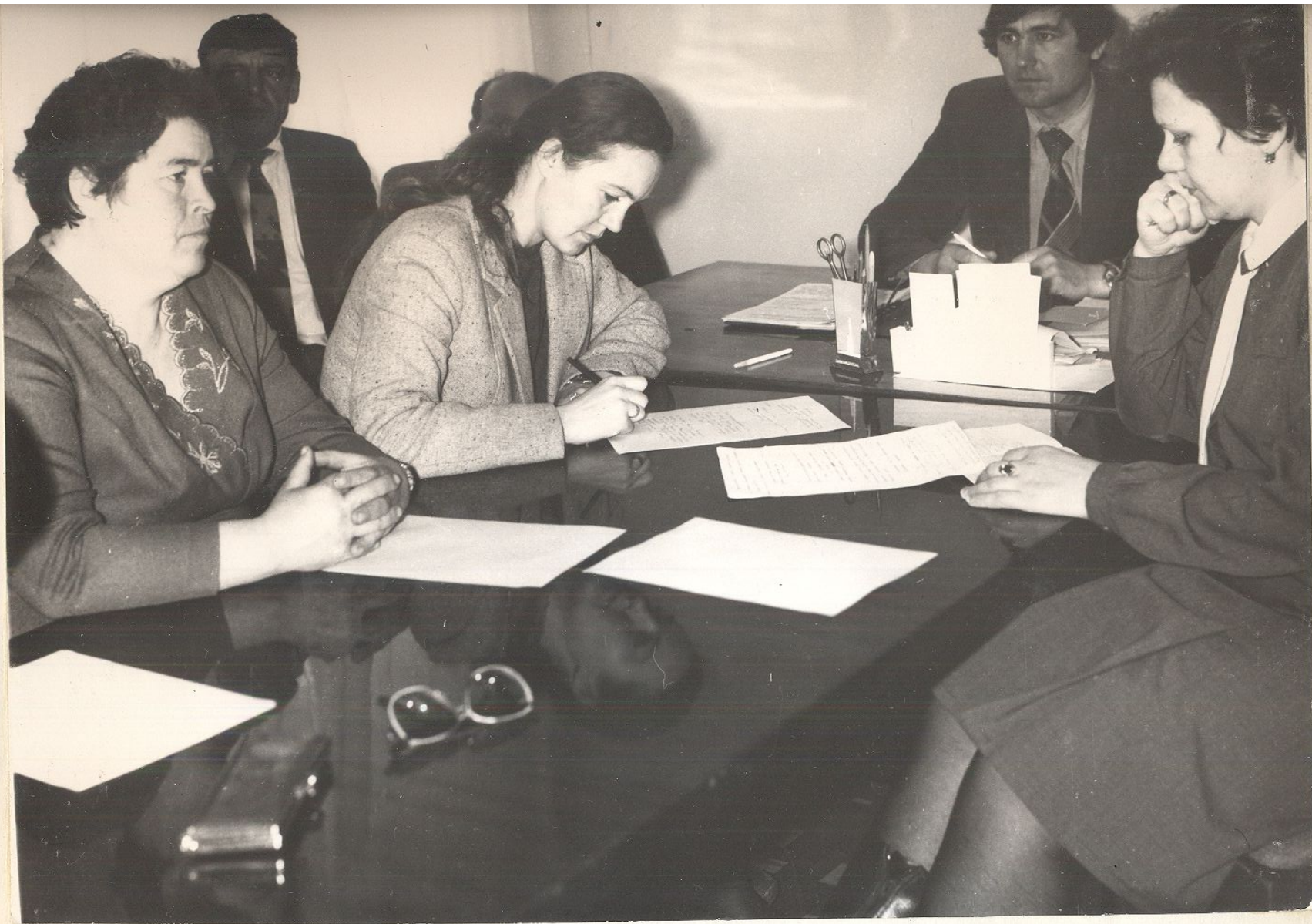
ЗАСЕДАНИЕ ПОСТОЯННОЙ КОМИССИИ РАЙОННОГО СОВЕТА НАРОДНЫХ ДЕПУТАТОВ ПО ЖИЛИЩНО-КОММУНАЛЬНОМУ ХОЗЯЙСТВУ, ДОРОЖНОМУ СТРОИТЕЛЬСТВУ И БЛАГОУСТРОЙСТВУ. Обсуждается вопрос благоустройства районного центра.