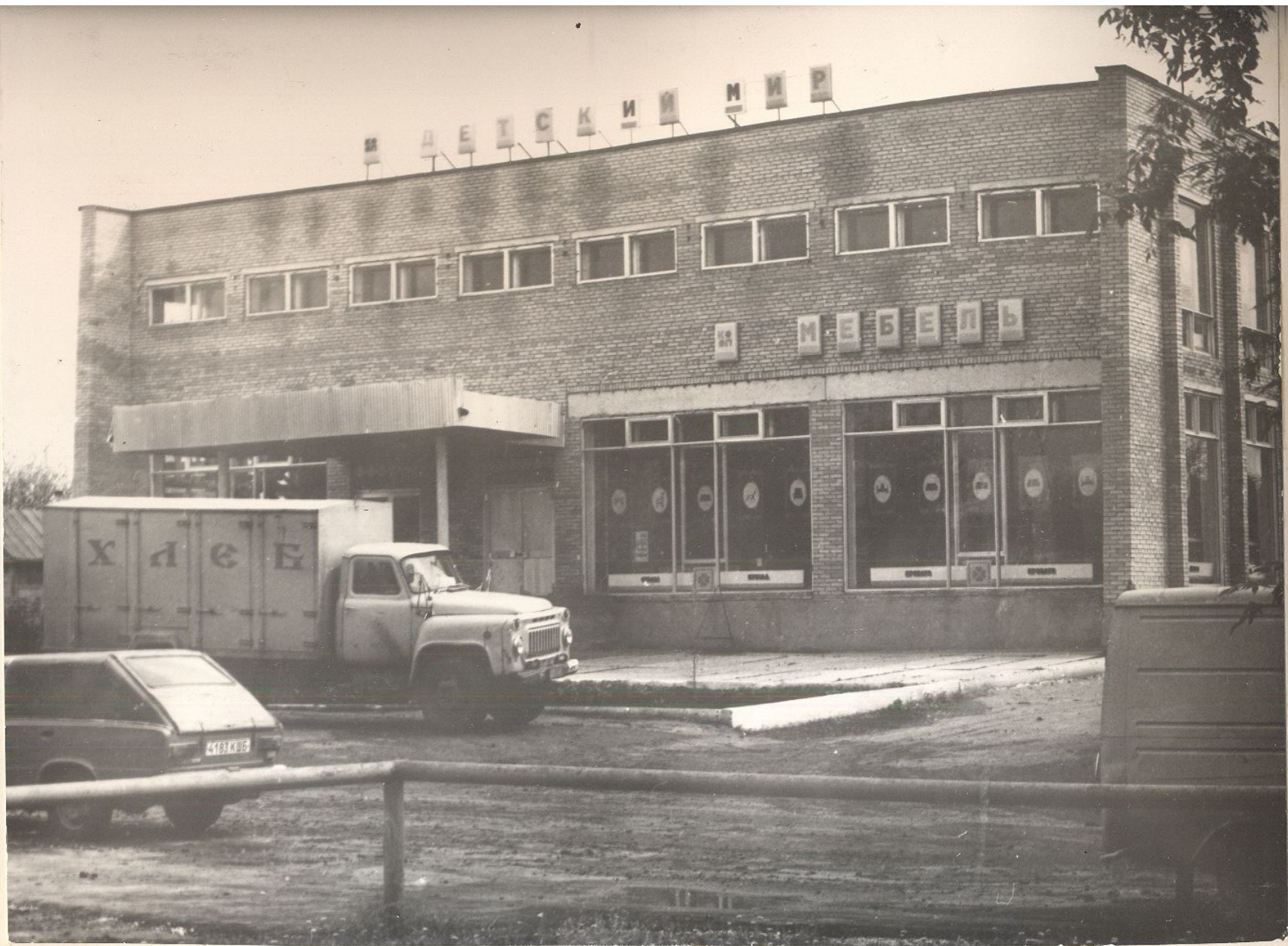
с. Пестровка. Новый магазин «Детский мир»