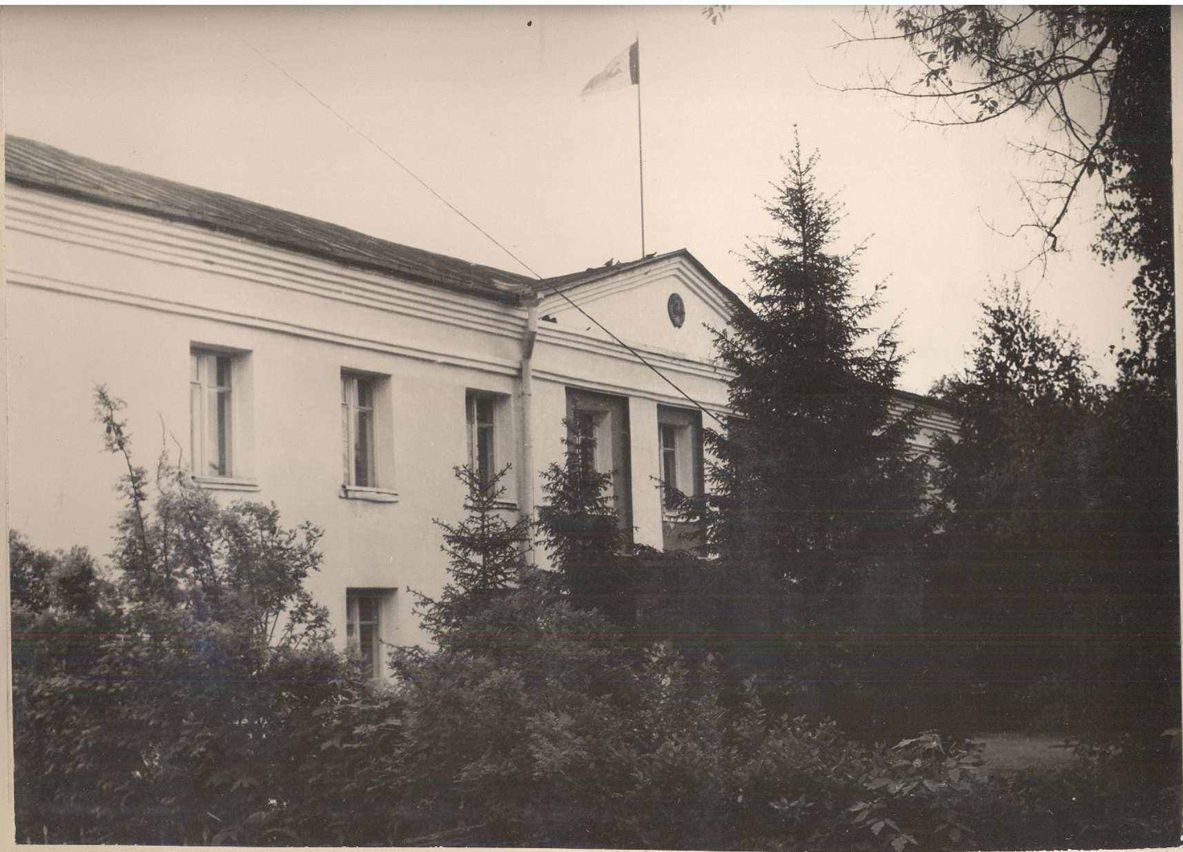
ЗДАНИЕ ИСПОЛКОМА РАЙСОВЕТА НАРОДНЫХ ДЕПУТАТОВ.