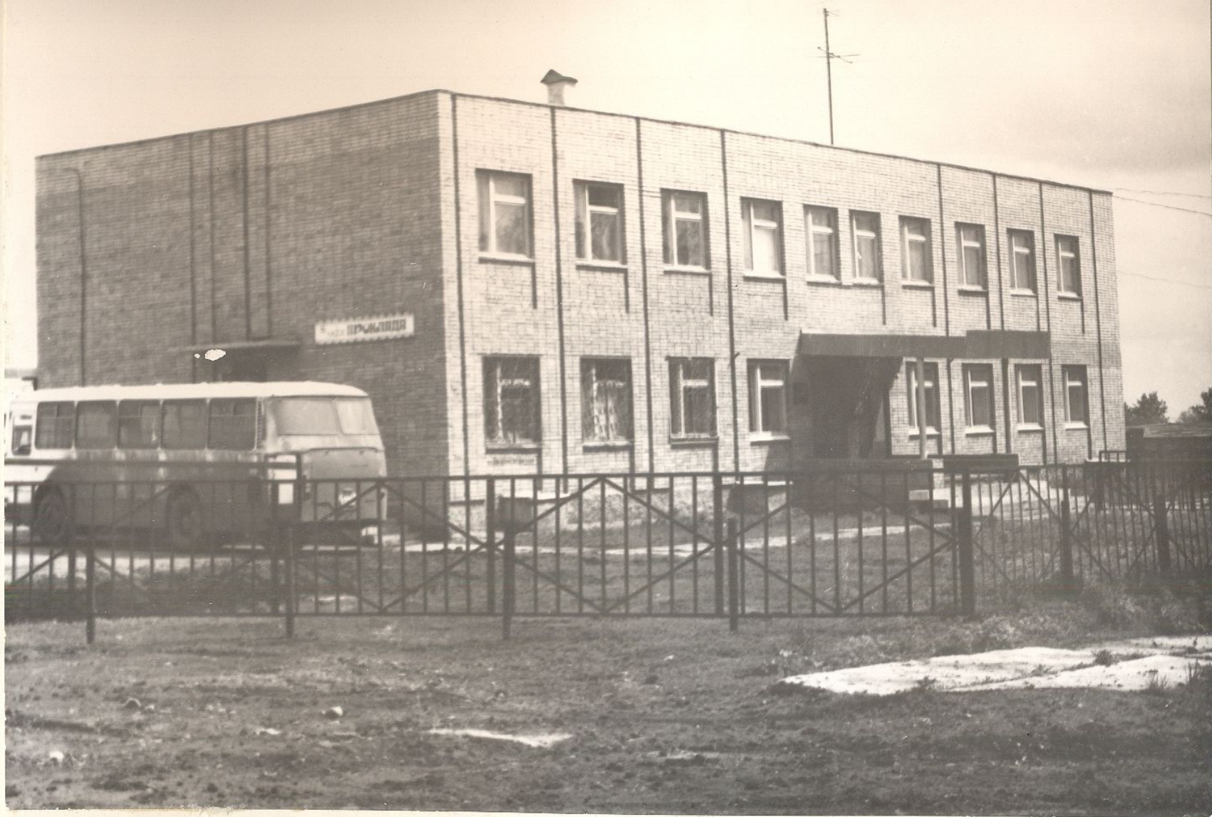
с. ПЕСТРАВКА. ЗДАНИЕ АВТОВОКЗАЛА НА 100 МЕСТ.